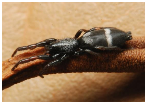
アマミトンビグモ

ペニーコマチグモ 三重県津市河芸町上野 2009年7月11日 1♂ 貝發憲治採集同定