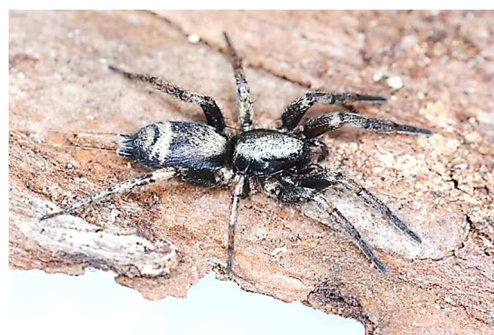
シノノメトンビグモ