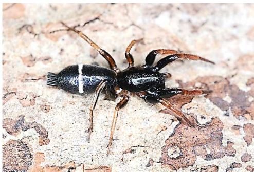
アマミトンビグモ

イヨグモ 大阪市東淀川区(食品工場の粘着板トラップで捕獲) トラップの設置期間:2017年5月17日～6月21日 2♂ 山下雅司採