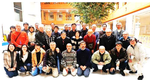
中部蜘蛛懇談会 2016年度総会・研究会 参加者一同